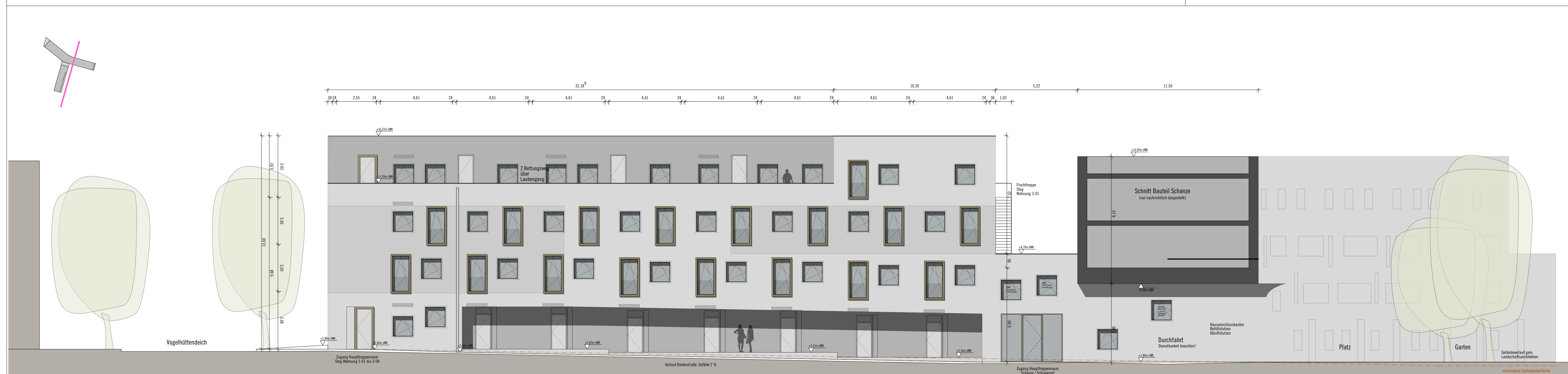
Ansicht 7 Ostseite / BT Steg