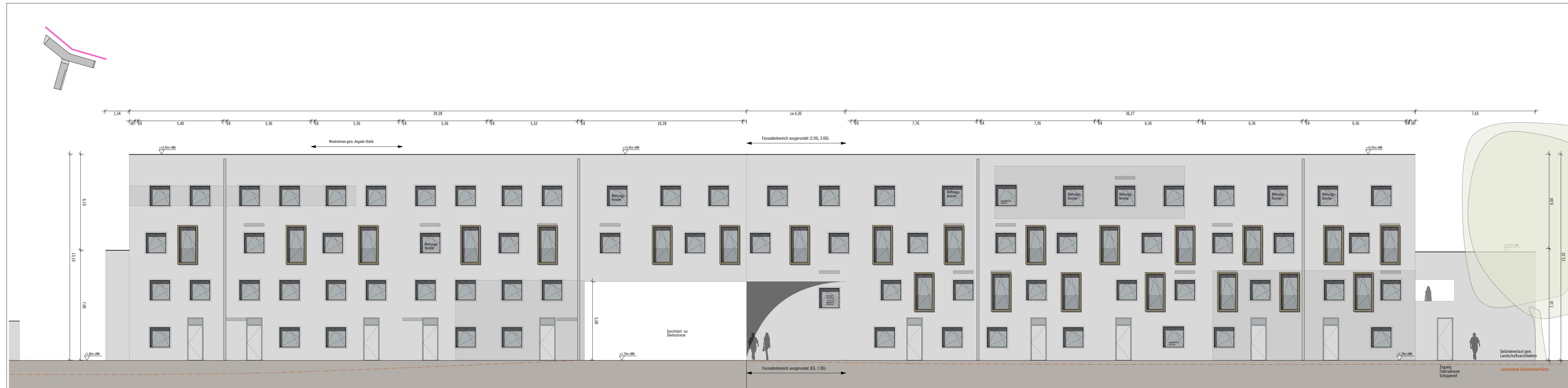
Ansicht 5 Nordseite / BT Schanze und Schipperort